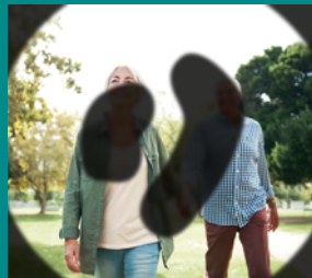
Fortgeschrittenes Stadium einer proliferativen diabetischen Retinopathie, die jetzt auch für den Patienten wahrnehmbare Gesichtsfeldausfälle zeigt.