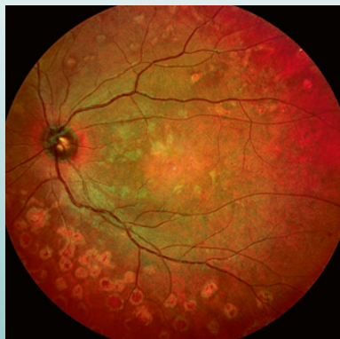
Weitwinkel-Fundusbild zur frühzeitigen Erkennung von ersten Veränderungen.

Mithilfe der präzisen Weitwinkel-OCT-Untersuchung und einem Weitwinkel-Fundusbild Ihrer Netzhaut, wird dies Ihrem Augenarzt ermöglicht.